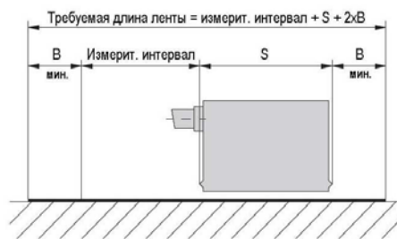
Определение длины ленты (датчик изображен условно)

Требуемая длина ленты рассчитывается следующим образом: Измерительный интервал + длина датчика "S" + (2 x припуска "B", спереди и сзади). Длина датчика "S": см. рисунок применяемого датчика; припуски спереди и сзади "B" = 100 мм